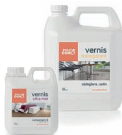
1L - 5L TRANSPARENT