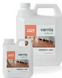
1L - 5L NATUREL