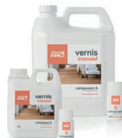
1L - 5L INTENSIF