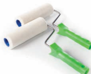
ROULEAUX COLLES - VERNIS