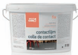
10Kg - 3Kg FIX