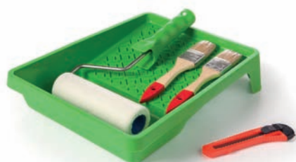
OUTIL DE POSE COLLES - VERNIS